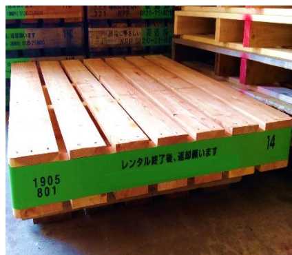
製造年月日・社名・着色に対応